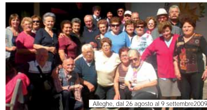
Alleghe, dal 26 agosto al 9 settembre 2009